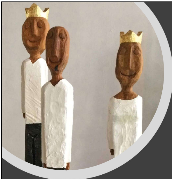
nach Psalm 118